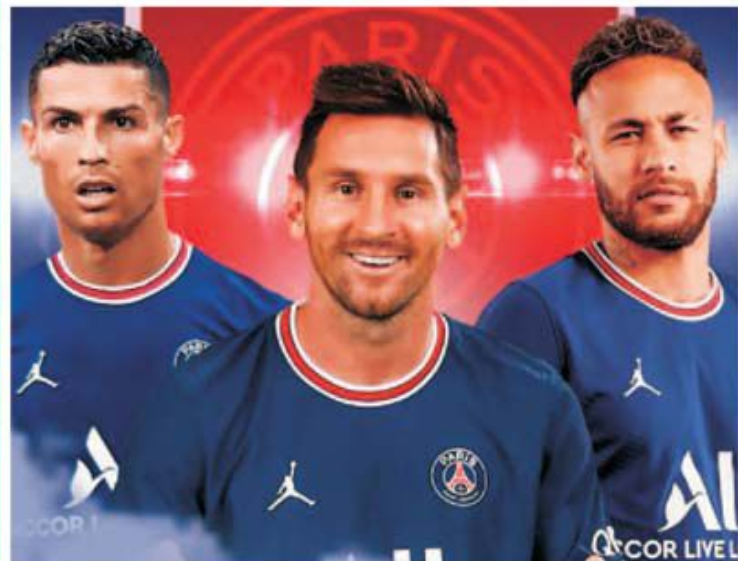
Ce trio de vis ar fi la Paris, scrie As, cu Messi-Neymar și CR7!

Șocul verii în plan fotbalistic nu a fost nici titlul european cucerit de Italia, nici cel olimpic al Braziliei, pentru a împlini un vis aparent de presă din lume, însă dacă informațiile din cotidianul As nu sunt doar praf pentru ochii lumii, se pregătește ceva inimaginabil.