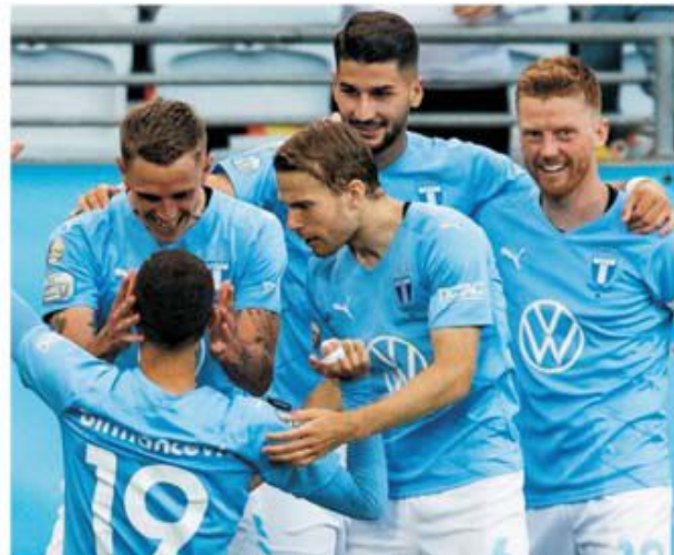
Jucătorii lui Malmö se felicită după ce au întors rezultatul pe Ibrox Park