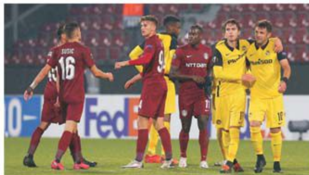
Clujenilor nu le-a mai rămas decât să admire jocul în viteză, plin de spectacol, al elvețienilor

Cartonaș roșu: Păun (63) A arbitrat Cuneyt Cakir (Turcia).