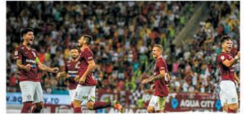
Bucuria rapidiștilor a fost imensă după succesul repurtat în fața FCSB-ului