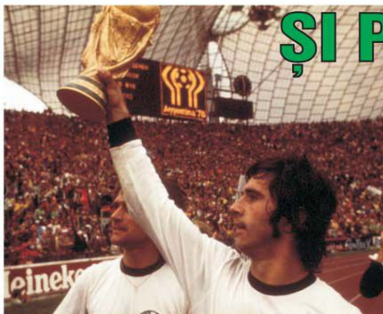
A murit la 75 de ani, suferind de Alzheimer, fostul mare internațional german Gerd Müller, autorul a mai multor recorduri în anii 70 pentru Bayern și pentru naționala RFG, campioană mondială în 1974

• Primul concurs din noul an competițional care cuprinde meciuri din Primera Division și Segunda Division, Prono-S din 14-15 august, se va omologa în cursul zilei de marți, deoarece trei întâlniri s-au desfășurat luni, Elche - Ath. Bilbao, Villarreal - Granada și Cartagena - Almeria, ultima fiind din eșalonul secund. Concursul a avut la start un report total de peste 15.000 de lei, iar în "weekend" nu pare să se fi înregistrat nicio "bombă", și nici măcar vreo surpriză. (E.I.)