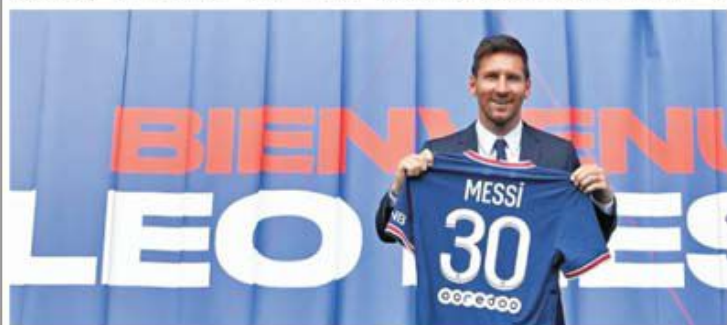
Lionel Messi a devenit parizian și promite multe trofee alături de prietenul Neymar

Multă lume nu poate înțelege succesiunea cu viteza luminii a