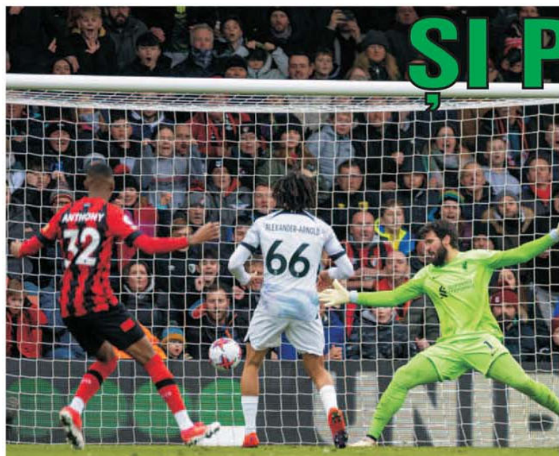
Nu mai Liverpool poate fi în stare de asemenea sușuri și coborâșuri de la o etapă la alta. De la 7-0 cu Manchester United a urmat 0-1 pe terenul nou promovatei Bournemouth, ultima clasată, pe care o bătuse acasă, în tur, cu 9-0!

• Optimile de finală alese să facă parte din concursul Prono-S din 9 martie 2023, partide din prima manșă a competițiilor continentale Europa League și Conference League, au condus la omologarea a 14 variante câștigătoare, jucate “la sfert” și premiate cu câte 283 de lei fiecare, la categoria a III-a. Pentru concursul următor, cu meciuri din aceleași întreceri europene, manșă secundă, reporturile sunt de peste 55.800 de lei la categoria întâi și 6.100 de lei la categoria a doua. (E.I.)