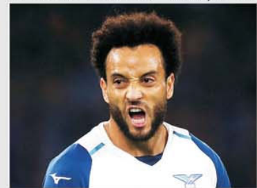
Felipe Anderson a semnat unicul gol al derby-ului capitalei disputat în tur, pe 6 noiembrie 2022

Runda a 27-a programează duminică viitoare eternul derby dintre Lazio și Roma, cunoscut ca Il derby della Capitale. În tur, meciul s-a încheiat cu succesul lazialilor, care au marcat prin brazilianul Felipe Anderson. Urmărind ultimele rezultate înregistrate de formațiile pregătite de Sarri și, respectiv, Mourinho, suporterii celor două team-uri trăiesc periculos pentru favoriții lor. Trebuie să ai nervii de oțel ca să treci de la momentele de extaz la acelea de agonie, și invers, ale celor două formații din capitala Italiei. Cu ceva de mai bine de o săptămână în urmă, Lazio o învingea pe Napoli chiar la poalele Vezuviului, pentru ca apoi să capoteze pe terenul amic în Europa Conference League contra celor de la AZ Alkmaar, iar patru zile mai târziu să smulgă doar un egal la Bologna, acolo unde Inter se împiedicase acum două săptămâni. Ce să mai spunem despre trupa lui Mou, care în doar patru runde a capotat în fața “lanternei roșii”, apoi le-a bătut pe Juventus și Real Sociedad, ultima în Europa League, ca să fie “masacrată” duminică, pe Olimpico, de Sassuolo. Semnalul de alarmă a fost dat deja atunci când Berardi și ai săi au învins la sfârșitul lui ianuarie cu 5-2 “diavolul” milanez chiar în capitala Lombardiei.