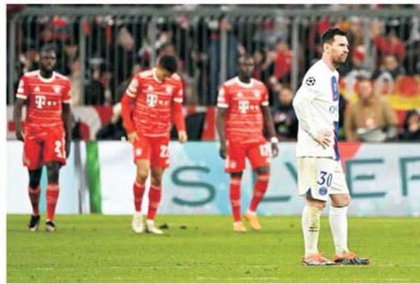
Leo Messi, rămas fără cuvinte după eliminarea din Champions League

prin curtea lui PSG, dar care nu s-a putut afirma acolo, Kingsley Coman. Șecii nu au renunțat, malaxor cu bani a înghițat alte sume colosale, s-a format triada divină care trebuia să măture tot, Messi - Mbappe - Neymar, dar rezultatul la acest moment este un mare faliment în plan sportiv. Cei trei nu se suportă, Neymar este proscrisul de care trebuie scăpat, pentru că așa vrea prințul Mbappe, dar fotbalul visat de șeci și de fani e poate doar pe play-station, nu pe teren. PSG a ieșit rușinos în optimile Champions League, la scor general de neprezentare cu același Bayern. Va cădea sigur capul antrenorului Christophe Galtier, va pleca la vară Neymar, vor mai pleca și alți jucători, dar întrebarea este