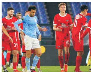
În tur, la Roma, olandezii de la AZ Alkmaar au produs surpriza, câștigând cu 2-1

Dintre toate partidele care se vor juca joi, 16 martie, în returul optimilor de finală ale Conference League, cea care va suscita în continuare cel mai mare interes rămâne AZ Alkmaar – Lazio,