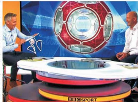
Trioul fostelor staruri din naționala Angliei, Gary Lineker, Alan Shearer și Ian Wright, erau punctele forță ale emisiunii de analiză la BBC după fiecare etapă din Premier League

Shearer! Mai mult, la boicot s-au raliat imediat toți antrenorii și jucătorii din Premier League, care pentru prima dată în acest sezon au decis să nu apară la nici un fel de interviu pentru Match of the Day. O imensă lovitură pentru BBC, obligată să reducă emisiunea la numai 20 de minute, doar cu rezumatele seci, fără nici un comentariu, ale partidelor din Pre-