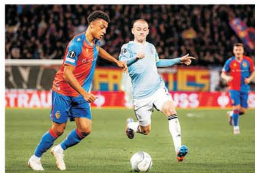
Duel obișnuit în FC Basel - Slovan Bratislava 2-2, una dintre surprizele concursului Prono-S din 9 martie 2023

Comentarii și pronosticuri: Sorin DUMITRESCU