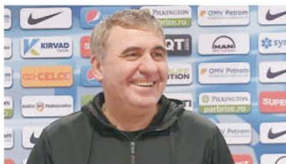
Gheorghe Hagi - un antrenor fericit