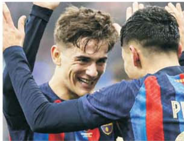
Tinerii Gavi (18 ani) și Pedri (20) par să construiască mijlocul Barcelonei pentru următorii 10 ani

meciuri cu gol primit și nu a câștigat în 6 din cele 10 partide fără victorie. Ziua de naștere a