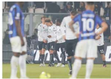
Jucătorii Inter-ului privesc șocați spre cei de la Spezia după primirea celui de-al doilea gol

Etapa a 26-a a avut două momente speciale, cu consecințe importante pentru zona primelor patru locuri, dar și a celor trei poziții retrogradabile. Prima bombă a explodat chiar în uvertura runde, la Spezia, unde echipa locală a reușit un meci tactic perfect și s-a apărat foarte bine, speculând totodată ezitățile defensive nerazzure. Spezia s-a impus cu 2-1, cu un al doilea gol marcat pe final, după ce Inter abia reușise să egaleze, și un mare merit aparține antrenorului de 56 de ani Leonardo Semplici, neînving în cele trei etape de când a preluat pe Spezia. Astfel Spezia se desprinde la cinci puncte de ocupanta primului loc retrogradabil, Verona. Semplici s-a aflat în vara anului 2020 foarte aproape de a semna cu campioana României, care se despărțise de Dan Petrescu. Rezultatul complică viața și pentru