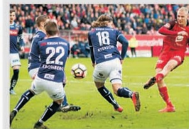
Mereu confruntările Brann Bergen – Molde și invers au fost foarte intense și destul de bogate în goluri

Nu mai este nici un secret că de cel puțin trei ani încoace când vorbim despre șansele la titlu în Eliteserien, prima divizie a Norvegiei, întâi rostim numele fostei adversare a lui Sepsi Sf.