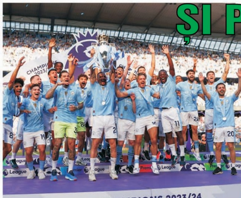
Manchester City a cucerit al patrulea titlu consecutiv în Premier League și al șaselea din ultimii șapte ani

● Luni, 20 mai, este programat meciul Bologna - Juventus, astfel că Prono-S din 18-19 mai, care a beneficiat de un report însumat de 62.746 de lei, se omologhează marți, 21 mai. Dintre surprizele înregistrate, am remarcat trei remize, la partidele Inter - Lazio, Cadiz - Las Palmas și Villarreal - Real Madrid, o victorie a gazdelor, la Torino - Milan, și una a formației vizitatoare, Cagliari impunându-se la Sassuolo (E.I.)