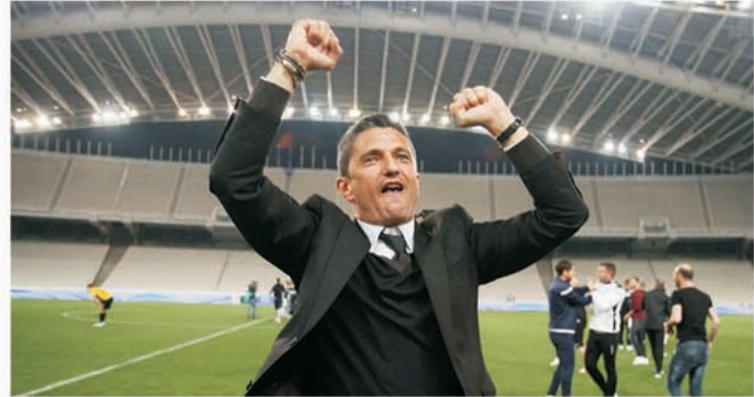
Răzvan Lucescu a câștigat după un meci de război cu vecina Aris Salonic pentru a doua oară titlul în Grecia

La distanță de mii de kilometri, la Salonic, un alt antrenor român, în vârstă de 55 de ani, Răzvan Lucescu, își savura la maxim momentul meritat de glorie. PAOK Salonic