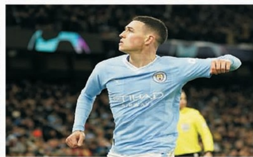
Phil Foden, autor al unei duble cu West Ham, a fost desemnat jucătorul sezonului în Premier League

mingham este o premieră. Campioană de șapte ori în First League, ultima dată în 1981, Villa a câștigat Cupa Campionilor Europeni în 1982, după 1-0 cu Bayern Munchen, dar nu a jucat niciodată în UCL. În Europa League va juca sigur Tottenham, care a terminat pe 5, și echipa de pe 6, în cazul în care campioana Manchester City va cuceri trofeul FA Cup. Este vorba de Chelsea. În cazul în care United se va impune în ultimul act, atunci "diavolii" vor evolua în a doua competiție conti-