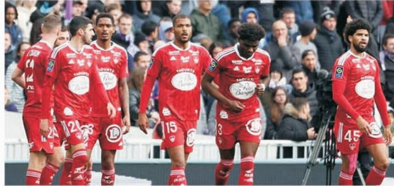
Extaz de fericire la Brest, care a scris istorie prin calificarea în grupele Champions

în grupele Champions League! Tot în Champions, dar în turul III, va fi Lille, care până în minutul 89 al meciului Toulouse - Brest, când oaspeții au făcut 3-0, era ea direct în grupe la golaveraj. În Europa League merg locul 5, Nice, și locul 6, Lyon. Lyon este senzația campionatului, pentru că până aproape de finalul turului s-a aflat fie pe post de lanternă roșie, fie pe penultimul loc, după care a început un urcuș la care nu mai credea nimeni, concretizat dintr-un penalty transformat în minutul 95 în calificare în grupele Europa League, plus bonus, finala Cupei. Locul 7, de Conference League, a revenit lui Lens,