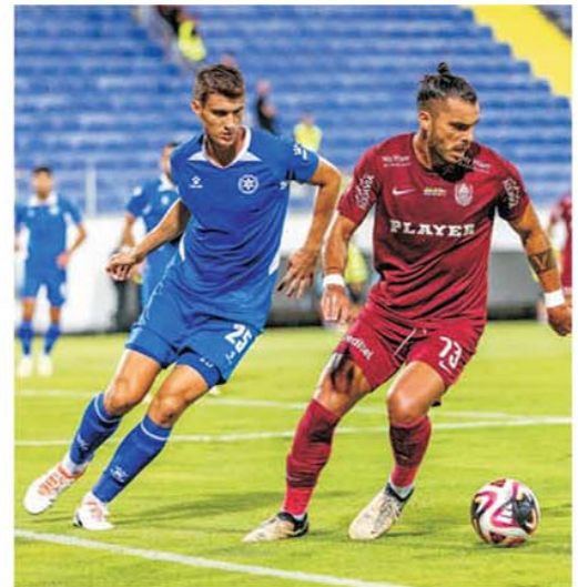
CFR Cluj a făcut un pas important pentru intrarea în play-off-ul Conference League, dar calificarea nu este deja tranșată

mingea respinsă de portar în urma șutului lui Bărligea. Toată lumea aștepta o desprindere clară a echipei lui Dan Petrescu, dar nu a fost deloc așa. Clujul a jucat slab, a mai ratat câteva ocazii bune, dar per ansamblu inițiativa a fost preluată, neașteptat, de israelieni, chiar dacă aveau la mijloc un jucător de 18 ani și altul de 19 ani. Portarul Sava a zburat literalmente în vinclul