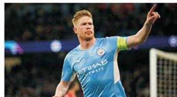
Kevin de Bruyne rămâne la Manchester City, în ciuda zvonurilor care îl dădeau plecat în campionatul Arabiei Saudite

Derby-ul primei runde le va pune față în față pe Chelsea și Manchester City, într-un duel programat, la Londra, pe Stamford Bridge. Meciul va aduce față în față echipa lui Pep Guardiola și cea a fostului său secund, italianul Enzo Maresca, numit antrenor la Chelsea la începutul acestei luni, după de a readus-o pe Leicester City în elita fotbalului englez. Pentru echipa gazdă va fi pentru a doua oară în istorie când înfruntă campioana