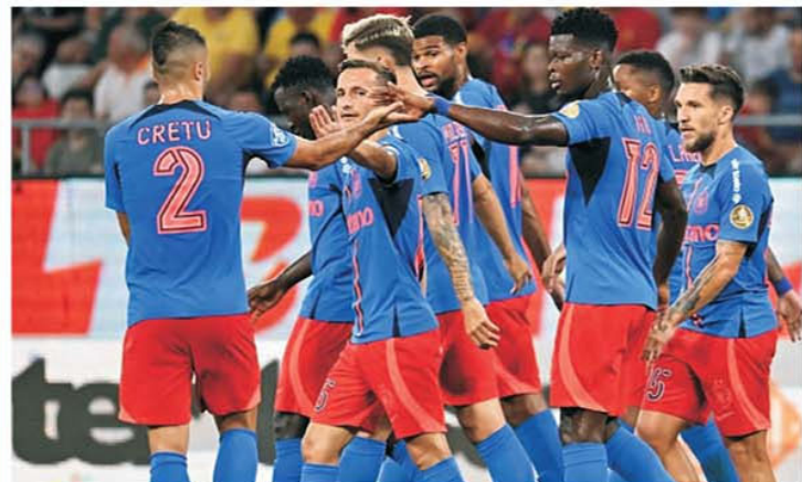
FCSB s-a chinuit să stingă Farul cu jucătorii din linia a doua, dar a făcut-o doar după ce a intrat artileria grea

continua parcursul european ar compromite orice șansă la promovare, neavând când să mai facă trecerea de la echipă de drept public la capital privat.