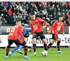
Meciurile dintre Rennes și Lyon au fost mereu disputate, echilibrate și destul de atractive

Începe Ligue 1, dar fără acele staruri de la PSG care au creat un imens interes pentru prima divizie a Franței. Ultimul mare nume, internaționalul francez Kylian Mbappe a spus au revoir Parisului la parametri zero, poposind în curtea clubului visat încă din copilărie, Real Madrid.