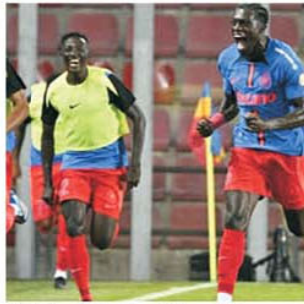
Golul lui Joyskim Dawa o creditează pe FCSB cu prima șansă la calificarea în play-off-ul Ligii Campionilor

primei părți i-a aparținut lui șut. Mijlocașul defensiv a scăpat spre poartă, a driblat