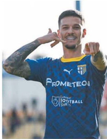
Dennis Man și-a prelungit de curând contractul cu formația parmegiană

Martinez Quarta, Ranieri, Pongracic – Dodo, Bianco, Mandragora, Biraghi – Nico Gonzalez, Colpani – Kean.