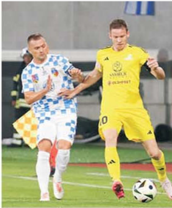
Greu de explicat metamorfoza în rău a Corvinului în a doua repriză a partidei cu Astana