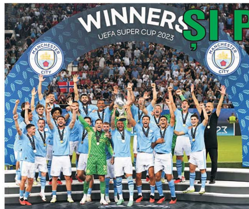
Supercupa Angliei a fost o afacere sută la sută a orașului Manchester. City a luat trofeul după executarea loviturilor de departajare în fața rivalilor de la United