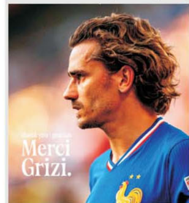
Antoine Griezmann a jucat pentru ultima dată în națională în meciul cu Belgia de la Lyon

maxim, iar bătălia pentru locul 2 se dă acum între reprezentativele celor două țări vecine. Surprinzător, Belgia deține ușoară superioritate în "directe", oficiale și amicale: 77 30-19-28. Balanța s-ar fi inclinat mai mult spre "dracii roșii" dacă "Les Bleus" nu și-ar fi adjudecat