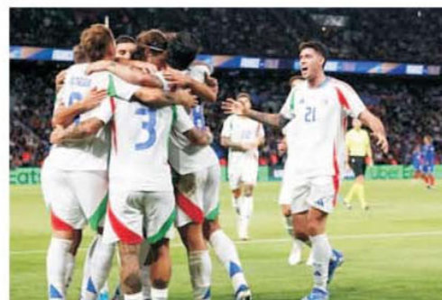
Italia s-a impus în prima etapă cu un 3-1 surprinzător la Paris, iar acum este lider în Grupa 2 din Liga A

Depunerea buletinelor de joc la concursul PRONO-S din 10-12 octombrie 2024 se poate face începând de duminică, 6 octombrie, după ora 16.00, și până joi, 10 octombrie, ora 16.00. Pe buletinele de joc SE VA MARCA RUBRICA DA, MIERCURI