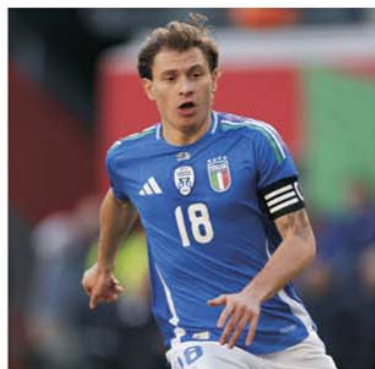
Nicolò Barella este la acest moment liderul squadrei azzurra

rezonabilă de șefii federației. În schimb, belgienii vor beneficia de aportul unui număr restrâns de bilete, deși au primit câteva mii, semn că raportul cu dracii roșii este tot mai șubred.