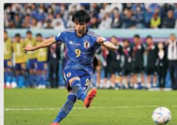
Mitoma va reprezenta, cu siguranță, un mare pericol pentru poarta saudiților

Australia și Japonia fac parte din grupa C și sunt primele două favorite, în condițiile în care o a treia echipă națională cu destule prezențe la Mondiale în ultimele două decenii, Australia, pare a avea acum un lot subțire valoric. De altfel se și vede din clasament, deși după doar două etape e prematur de dat verdict. Japonia e prima, cu un golaveraj uluitor, 12-0 (7-0 cu China și 5-0 cu Bahrain), saudiții sunt pe doi, dar fără a arăta ceva (2-1 în China și un șocant 1-1 pe