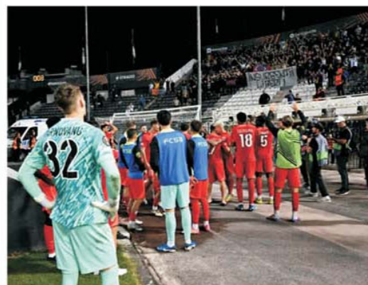
Rar s-a văzut o asemenea dominație ca la Salonic, dar FCSB a făcut o seară de neuitat, de imens sacrificiu

Pe teren echipa sa a intrat în rolul celui care suferă de la primele atingeri de balon. Învinsă în primul meci, la Istanbul, de Galatasaray, cu 3-1, echipa greacă, pregătită de zeul