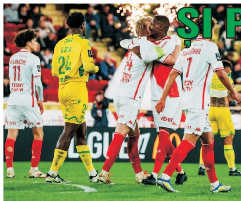
FC Nantes a suferit la Monte Carlo cea mai mare umilință din ultimii 25 de ani, primind nu mai puțin de șapte goluri de la monegaschi