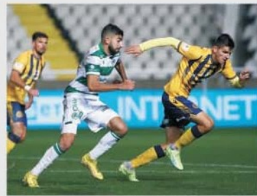
După 1-1 în tur derbyul cipriot Pafos – Omonia Nicosia se va disputa pe viață și pe moarte pe terenul primei echipe

La această oră Conference League poate trimite în faza optimilor nu mai puțin de două cluburi din Cipru. Adică APOEL Nicosia, despre care aminteam, are toate atuurile să pună la respect pe Celje din Slovenia după 2-2 pe terenul acesteia, iar Pafos – Omonia Nicosia este sută la sută un derby al Ciprului. Care și el va porni tot de la un scor egal, 1-1. Așa încât chiar va fi greu să anticipăm echipa care va continua să joace în Europa. Dacă ne uităm la clasamentul din campionatul Ciprului, ținând cont că ambele combatante provin de aici, după 22 de etape Pafos, marea revelație a ultimilor doi ani, după ce a fost cumpărată de un personaj plin de bani, are nu mai puțin de zece puncte peste rivala din acest meci, fiind lider, iar Omonia ocupând treapta de bronz. Deci avem în Europa un meci de gală al fotbalului din Țara Afroditei, între două echipe