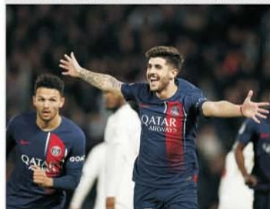
Lyon – PSG este meciul dintre cele două cele mai titrate cluburi din Ligue 1

Când vorbim despre hegemoniile din Hexagon, din Ligue 1, avem doar două cluburi care au reușit performanța de a lua în posesie titlul pe o perioadă însemnată de ani. Și ambele puteri au strălucit după intrarea în secolul 21, adică după intrarea în perioada anilor 2000. Olympique Lyon este prima dintre cele două regine ale fotbalului francez. Perioada de domnie a fost între