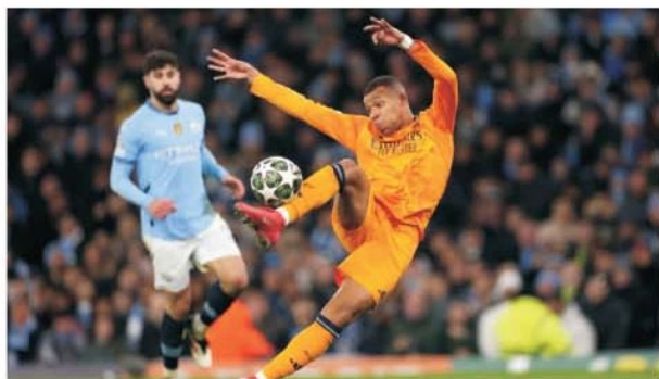
Kiljan Mbappe și-a făcut datoria și a marcat pentru Real în disputa cu Manchester City

Manchester City - Real Madrid este block-busterul rundei, iar prima manșă a dublei a fost de-a dreptul spectaculoasă. Mai întâi, Haaland nu l-a iertat pe Courtois și a deschis scorul în minutul 19 din pasa lui Gvardiol. Campioana en-titre a venit "montată" de la