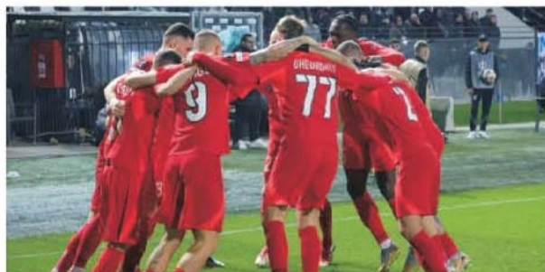
FCSB a învins a doua oară pe PAOK la Salonic și a devenit nașa echipei elene

FCSB este cu un picior în optimile de finală ale Europa League după ce s-a întors victorioasă joi seară, de la Salonic, de la meciul tur din cadrul play-off-ului acestei competiții. Cum și în prima fază a noului format al Europa League bucureștenii reușiseră să se impună acasă la echipa lui Răzvan Lucescu, atunci cu 1-0, acum cu 2-1, se poate spune fără teama de a exagera că ei pot fi socotiți de acum înainte drept nașii tehnicianului român. Sigur, nu trebuie să vedem deja toți sacii în căruța latifundiarului din Pipera, pentru că mai există un retur și în fotbal s-au văzut multe "remontade" și mai imposibile. De aceea am