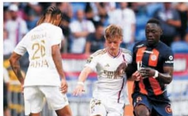
Lyon poate fi un mare pericol pentru FCSB dacă va fi adversară în optimile Europa League

S-a jucat etapa a 22-a din Ligue 1. Fără să forțeze PSG s-a impus cu 1-0 la Toulouse, într-un meci în care cel mai bun de pe teren a fost declarat fundașul central Umit Akdag de la gazde, un internațional român de tineret. PSG păstrează avansul de 10 puncte față de locul 2, Marseille, care a zdrobit acasă cu 5-1 pe Saint