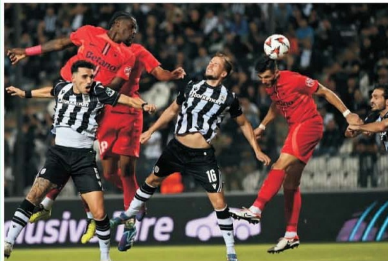
FCSB a câștigat la Salonic, dar la 2-1, deși avea om în plus, a sunat în mod inexplicabil retragerea

marcat două goluri și și-a pus adversarul în situația de a fi numărat mai ales din punct de vedere mental. Era momentul perfect pentru a decapita definitiv rivalul. PAOK se afla în stare de anestezie a ideilor, tot ce făcea era