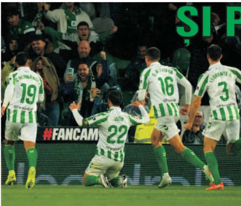
Real Madrid a capotat pe terenul lui Betis Sevilla și a căzut astfel pe locul 3 în La Liga

● Concursul Prono-S din 1-2 martie, construit numai cu partide din Serie A și La Liga, a furnizat două variante câștigătoare, la categoria a III-a, apărute la Călărași și Iași, fiecare a câte 3.824,40 de lei, iar reportul însumat de la primele două categorii depășește 212.200 de lei. La omologare a contat apariția unei serii de patru "X"-uri în Spania, un semn "1" la meciul Leganes - Getafe, precum și un "2" la Milan - Lazio. (E.I.)