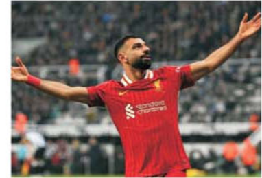
Mohamed Salah face un nou sezon de vis în tricoul lui Liverpool

Liverpool a deschis scorul rapid. În minutul 11, Szoboszlai a primit mingea de la Diaz și a șutat-o în plasă de la marginea careului. În ciuda ocaziilor pe care le-au avut ambele echipe, tabela nu a mai fost modificată până în repriza secundă. În minutul 63, Salah i-a dat o pasă perfectă lui Mac Allister, care l-a învins pe portarul lui Newcastle cu