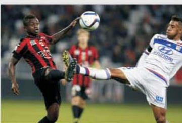
Disputele Nice – Lyon au însemnat mai mereu meciuri deschise, cu goluri

prinde măcar locul 4, care duce în play-off-ul Champions League. Din acest punct de vedere gazdele sunt evident mult mai bine situate, pentru că există o diferență destul de clară ca și număr de puncte între ele. E drept, de la această partidă vor mai fi destule etape până la tragerea cortinei peste acest sezon, dar Nice poate spera chiar la locul 3, pentru că a avut evoluții constant bune de peste două luni. Poate fi un meci bogat în goluri pentru că