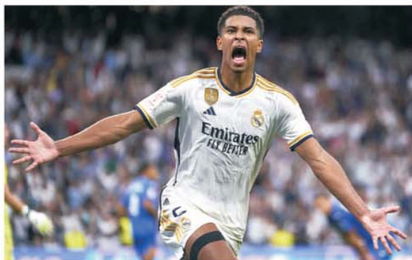
Englezul Jude Bellingham este unul dintre oamenii de bază ai Realului de la venirea sa pe Bernabeu

Marți și miercuri se vor disputa partidele din prima manșă a optimilor Ligii Campionilor. În urma tragerii la sorți din 21 februarie cele 16 formații rămase în competiție s-au împerecheat astfel: Benfica - Barcelona, PSG - Liverpool, Feyenoord - Inter, PSV Eindhoven - Arsenal, Bayern - Leverkusen, Real Madrid - Atletico Madrid, FC Bruges - Aston Villa și Dortmund - Lille. Tragera la sorți a decis două întâlniri între echipe din aceleași țări. Bayern se va lupta cu campioana Leverkusen pentru un loc în sferturi, în timp ce Real și Atletico vor disputa derby-ul pentru supremația orașului Madrid. Formația lui Simeone are de luat o revanșă, după ce a pierdut două finale ale Ligii Campionilor în fața acesteia. Un alt meci extrem de tare