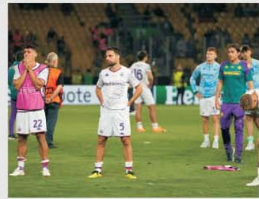
La Atena Fiorentina a trăit a doua dezamăgire a ratării trofeului Conference League, învinsă de Olympiacos

În optimile de finală ale Conference League avem meciul Panathinaikos Atena – Fiorentina, ca multe alte întâlniri din această a treia competiție intercluburi de pe continent o partidă extrem de echilibrată și, prin urmare, foarte greu de prevăzut. Cu siguranță însă că italienii și-ar fi dorit orice alt adversar în afara lui Panathinaikos. Și asta nu pentru că verzii din Atena ar alcătui un team foarte periculos, ci pentru că vor fi nevoiți să retrăiască la mai puțin de un an traumatizanta vedere cu orașul unde vara trecută pierduseră pentru a doua oară consecutiv finala Conference League, în fața unui dușman al lui "Pana", Olympiacos Pireu. A fost un 1-0 după prelungiri, într-o atmosferă incendiară, capitolul la care fanii eleni sunt neîntrecuți, iar o bună parte dintre cei care s-au aflat atunci pe teren vor fi și acum. Și suporterii lui Panathinaikos sunt la fel de exploziv, deci va fi din nou o întâlnire cu iadul pentru squadra violetă. Doar că pe bancă nu mai este Vincenzo Italiano, cel cu care s-au pierdut ambele finale (un an mai devreme cu West Ham), ci Raffaele Palladino. Care nu se poate spune că are foarte multă experiență în Europa, pentru că vine de la Monza, lanterna roșie din Serie A acum. Este lesne de înțeles dorința celor de la